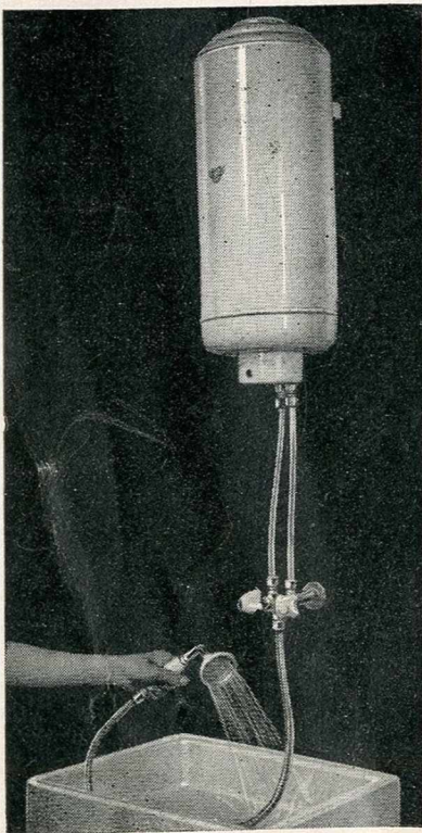
Fig. III. — Douche générale